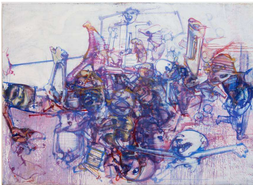
Dado, L' cole d'Ivo, 2006, Huile sur toile, 201x280 cm, Collection Mus e R gional d'Art Contemporain L-R, S rignan